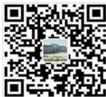
扫描二维码，关注图书馆微信公众号

注：读者通过绑定图书馆微信公众号，可了解图书馆动态，进行图书检索、图书荐购、座位预约、入馆教育、在线阅读、图书借阅信息查询与续借等功能。读者绑定图书馆微信公众号的用户名为读者的一卡通账号，密码为统一身份认证登录密码（初始密码为身份证后六位）。